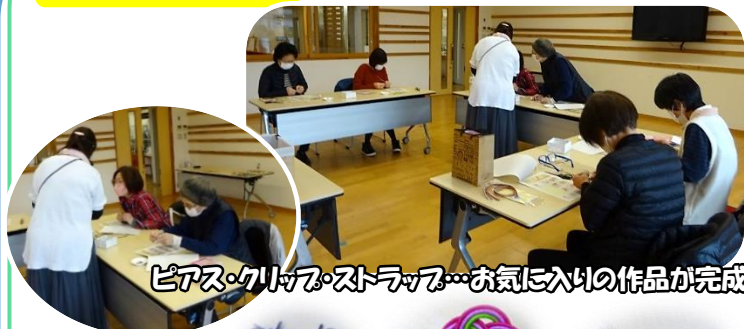
ピアス・クリア・ストラップ...お気に入りの作品が完成!