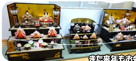
また来年もお会いしましょうね〜