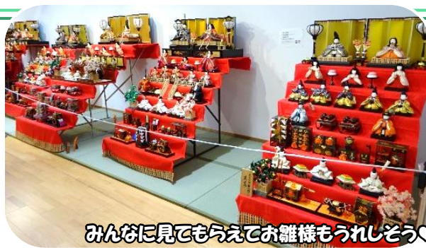
みんなに見てもらえてお雛様もうれしそう♡

今年も地域の皆さまに、ひな人形展示提供のご協力をいただきました。 お陰様で100年以上前の歴史ある年代ものから近年のものまでたくさんのお雛様が並び、延べ来館者1042名の皆さまに楽しんでいただくことができました。 中には、「家に長いこと飾っていないお雛様があるし、来年持ってくるわ〜」と来年の展示予約をしてくださった方もあります(よろしくお祈りしますね〜) 来年もまた、ぜひ、皆さまのお雛様をお貸しください。