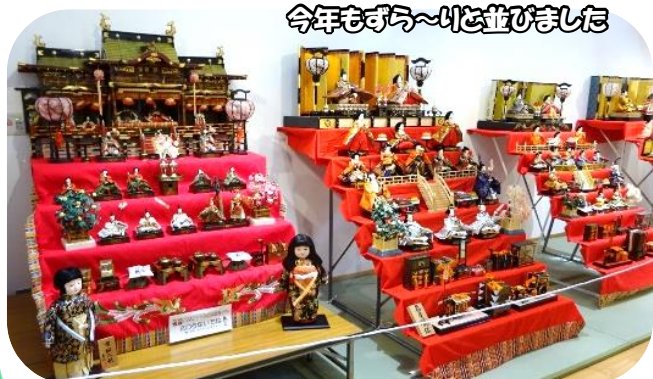
今年もすう〜りど並びました