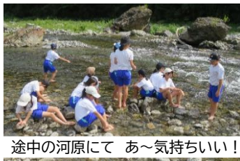
途中の河原にて あ〜気持ちいい!