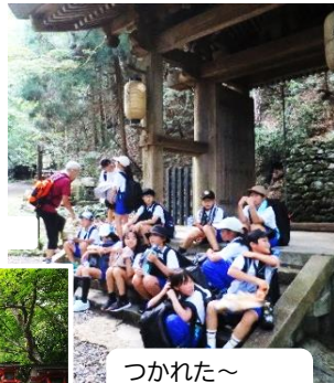
つかれた〜 到着まであと少し みんなでがんばろー!