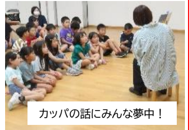
カッパの話にみんな夢中!

こども家族館職員によるクラフトづくり体験、名田庄図書館職員による読み聞かせの会、DVD 上映会などで夏休みのひと時を楽しみました。