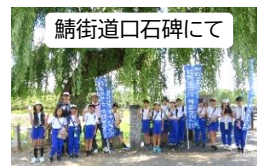
鯖街道口石碑にて