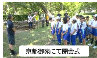
京都御苑にて閉会式