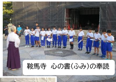
鞍馬寺 心の書(ふみ)の奉読