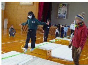
(公民館生涯学習推進委員会主催)