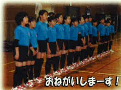
おねがいしまーす！

この「名田庄スターキッズ」は、結成20年を迎えます。結成当時は、卓球や野球など、男子児童が中心となるスポーツ少年団ばかりだったので、女子児童の体力向上を図ることを目的にスポーツをする機会をと、立ち上げられたそうです。