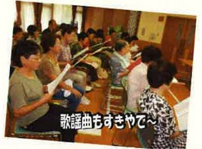
歌謡曲もすきやで～

大勢で思いっきり大きな声で歌うと気持ちも高揚しみんなの声と心がひとつになり歌の世界が広がります。