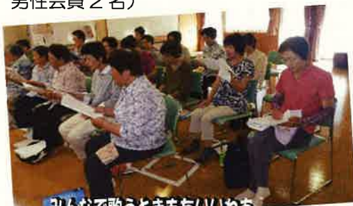
みんなて歌うときもちいいわ

中には、たまたま診療所へ来た時に歌声が聞こえ、のぞいてみたらみんな楽しそうに歌っていたので「ぜひ自分も仲間に入れてほしい！」と中名田から参加の男性会員もいらっしやいます。(男声が入ることで響きに幅ができボリューム感があるそうです。現在男性会員2名)