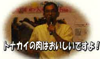
トナカイの肉はおいしいですよ!