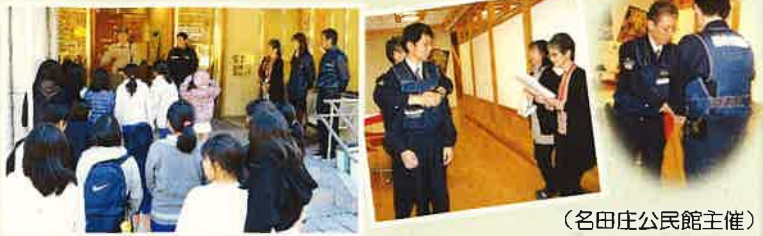
(名田庄公民館主催)

1階ホール控室からの出火想定で避難訓練を実施しました。ゆきんこらんど(放課後子ども教室)の児童も一緒に訓練に参加し、若狭消防署名田庄分署の方から正しい避難について学びました。その後児童たちは、小浜警察署生活安全課職員の方からも「知らない人について行かない」などの不審者への注意を聞き、また公民館職員も、護身術や非常時の対応を教えてくださいました。