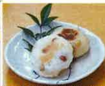
ホットプレートでこんがり焼いたらできあがり!

そして最後に、「これからも健康に良い伝承料理の大切さをみんなに伝えていきたい」と抱負を語っていただきました。