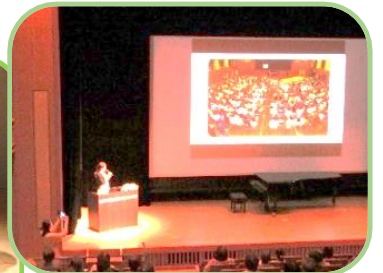
(図書館・公民館共催)