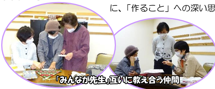
「みんなが先生」互いに教え合う仲間