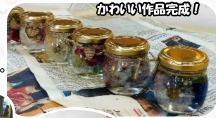
かわいい作品完成!

長いピンセットを使って、たんぼぼの綿毛をそお〜と瓶に入れる工程を楽しんだ皆さん、小さな瓶の中の世界をとっても嬉しそうに眺めていました。