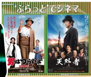
【公民館生涯学習推進委員会】