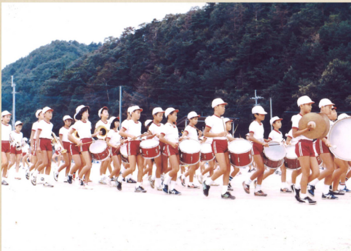
昭和60年 名田庄村民体育大会 名田庄中学校