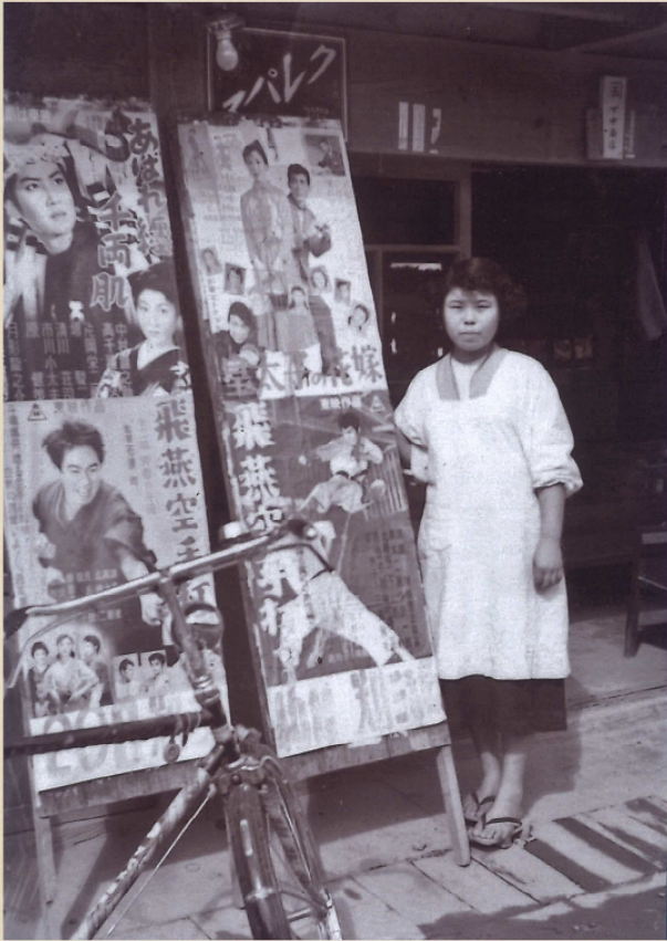
昭和31年秋 ござ商店前 映画の宣伝看板と売り子さん 名田庄久坂