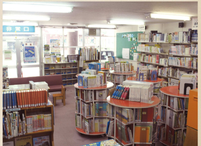
平成22年 旧名田庄図書館 名田庄山村開発センター